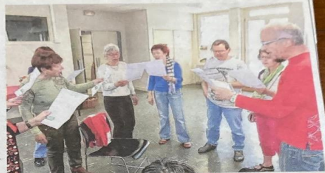
■ Un chœur qui bat fort lorsqu'il entonne « Les gars du GPL », un hymne aux valeurs du club.

On marche beaucoup au GPL, mais on y échange aussi beaucoup. Des liens forts se sont tissés au fil des ans au sein de cette grande